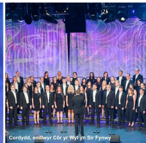
Cordydd, enillwyr Côr yr Wyl yn Sir Fynwy